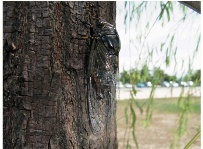
金沢市内で見つけたスジアカクマゼミ。翅の脈や足の一部が赤橙色をしているのが特徴。