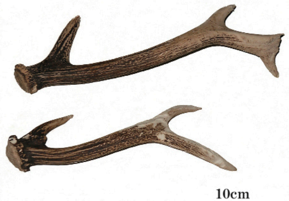
金沢市森本の山中で見つかったシカの角