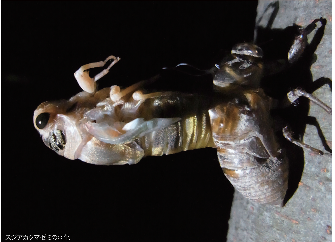
スジアカクマゼミの羽化