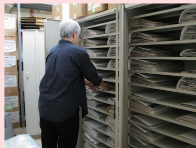
標本を標本棚に配架する作業