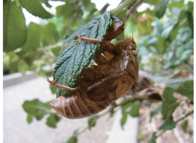
石川県内で見つかったクマゼミの抜け殻（金沢市鞍月）