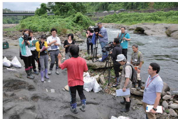
図2. 報道対応の様子

このクジラ化石は非常に貴重なものであり、この発見を石川県民に広く伝える必要があると判断したため、7月14日に報道機関に公開しました（図2）。その後、実際に発掘現場を訪れ、母岩から切り離していない状態の化石をご覧になった一般の方々もいらっしゃいました。