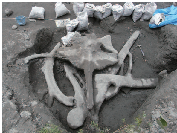
図1. 発掘されたクジラ化石 （ハンマーの長さは約30cm）