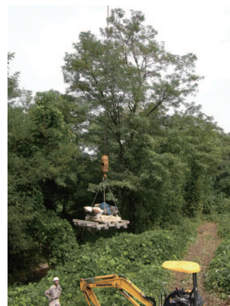
図3 クレーンで吊上げられる 頭蓋骨主要部

今後は、このクジラ化石の同定を含めた、標本自体の研究とともに、発掘中に得た様々な地質学的、古生物学的データから、この個体が死んで埋没するまでの過程の解析を実施することになります。しかし、その前に、化石を母岩から取り出すクリーニング（割出）作業を行わなければなりません。これには多くの費用と時間を要しますが、発掘と同様、根気強く取り組んでいきます。