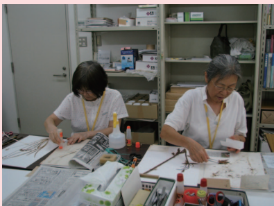
標本を台紙に貼付する作業