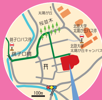
資料館周辺地図(拡大)