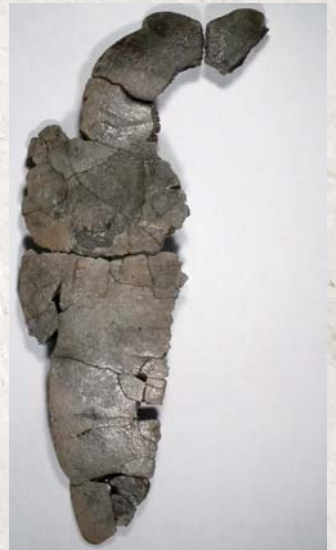
陸ガメ類の右腹甲