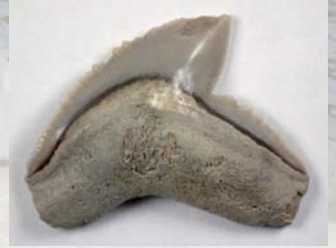
イタチザメ類の歯

大桑層は多くの貝化石を産出することで有名ですが、さまざまな種類のせきつい動物の化石も発見されています。今回の企画展では、当館所有の大桑層産化石標本のうち、クジラ類や、アシカ類、魚類などのせきつい動物化石を中心に公開・展示します。